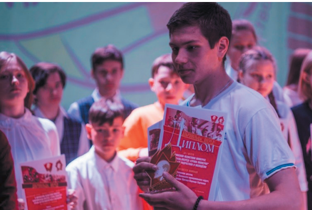
ОБЛАСТНОЙ КОНКУРС «ДОБРОВОЛЬЦЫ, ВПЕРЕД!»