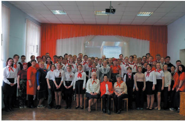
СБОРЫ АКТИВА В РАЙОНАХ И СЕЛАХ