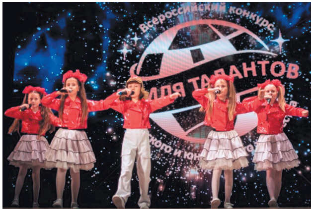
ВСЕРОССИЙСКИЙ КОНКУРС «ЗЕМЛЯ ТАЛАНТОВ»