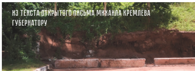
ИЗ ТЕКСТА ОТКРЫТОГО ПИСЬМА МИХАИЛА КРЕМЛЁВА ГУБЕРНАТОРУ